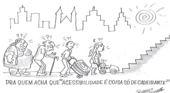
Figura 1 – Charge de Ricardo Ferraz