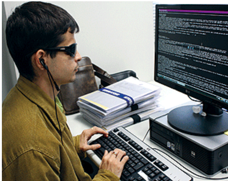
Figura 2: Pessoa utilizando software leitor

Descrição da imagem: Fotografia colorida horizontal. Um rapaz de perfil olha para a tela do computador e digita em um teclado comum. Ele tem cabelos curtos, veste camisa de manga longa, usa óculos escuros e fones conectados ao computador. Do lado esquerdo do equipamento há papéis empilhados e uma bolsa de couro marrom (fim da descrição).